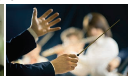
Konzerttickets sind erhältlich auf www.reservix.de