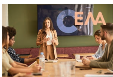
BDB-Musikakademie Gewerbstraße 5 79219 Staufen im Breisgau